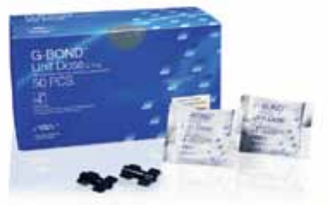
GC G-BOND Набор Унидоз

Содержит: Одна 5 мл бутылочка GC G-BOND, одна упаковка из 50 микроаппликаторов, 1 держатель для аппликаторов, 1 блок для замешивания и руководство по применению.