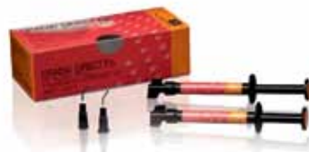
GC GRADIA DIRECT Flo

GC EUROPE N.V. GC EEO Siget 19b HR - 10020 Zagreb, Croatia Tel. +385.1.46.78.474 Fax. +385.1.46.78.473 E-mail info@eeo.gceurope.com www.eeo.gceurope.com