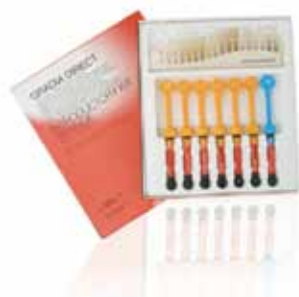
GC GRADIA DIRECT

Светоотверждаемый реставрационный композит помогает стоматологам легко и быстро создавать естественно выглядящие долговечные реставрации для фронтальной и жевательной групп зубов. Простая однослойная техника нанесения обеспечивает нужный результат, но при необходимости можно добавить целый спектр специальных оттенков.