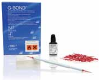
GC G-BOND Набор с Бутылочкой

Содержит: Одна 5 мл бутылочка GC G-BOND, одна упаковка из 50 микроаппликаторов, 1 держатель для аппликаторов, 1 блок для замешивания и руководство по применению.